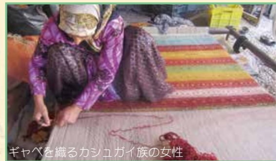
ギャベを織るカシュガイ族の女性