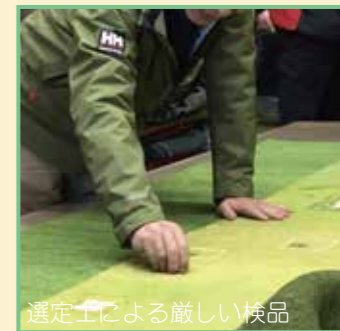
選定士による厳しい検品